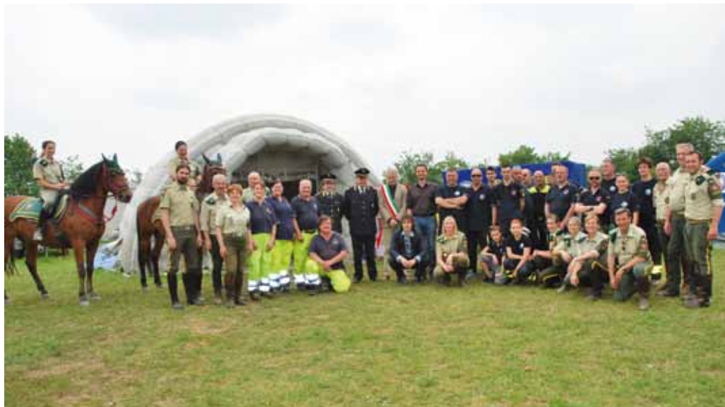
■ L'edizione 2015 della manifestazione ad Inzago ha ospitato una vera e propria esercitazione in cui cavalli e cani hanno cercato insieme le persone disperse

si terranno in contemporanea all'interno del Parco dell'Idroscalo, dove le Giacche Verdi sono di casa, vantando da molti anni un rapporto di collaborazione con l'ente gestore, la Città Metropolitana di Milano, per i controlli di sicurezza dell'area. Dal 2012, inoltre, all'Idroscalo i volontari hanno una vera e propria sede operativa, che fa da base per le attività della loro Scuola di equitazione di campagna, attiva nell'arco dell'intero anno. Nel corso del raduno di ottobre, per i lavori d'aula verrà utilizzato lo spazio della Sala Azzurra, che servirà anche per