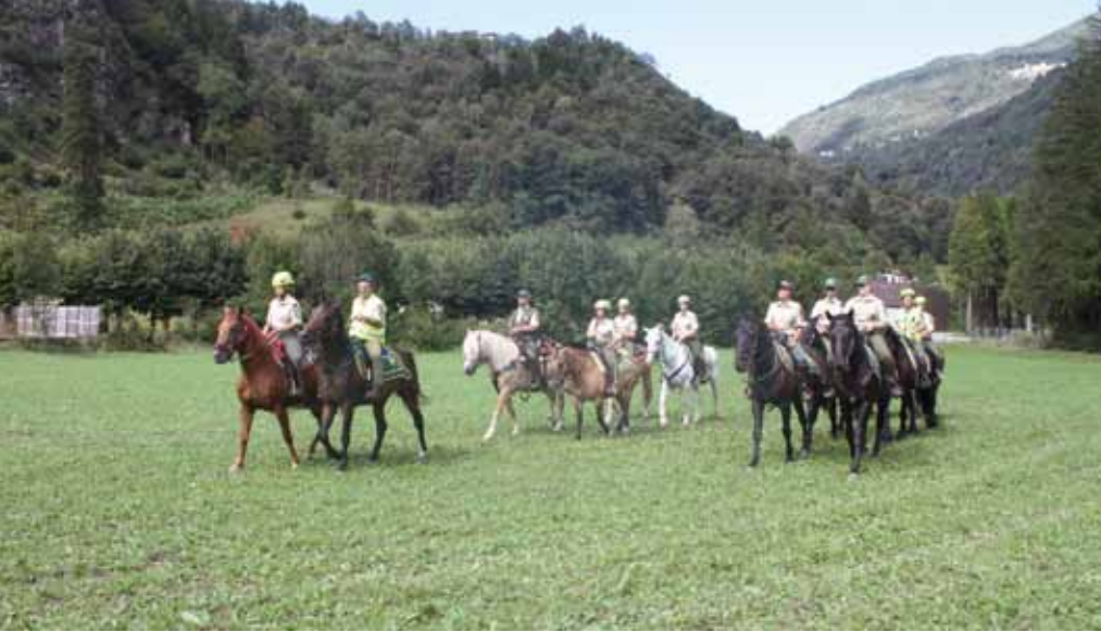
■ Qui a lato, il raduno regionale delle Giacche Verdi Lombardia lo scorso anno a Taceno (Lecco) e, sotto, una squadra equestre mentre si esercita nel trasporto di medicinali e viveri con l'ausilio di un cavallo col basto