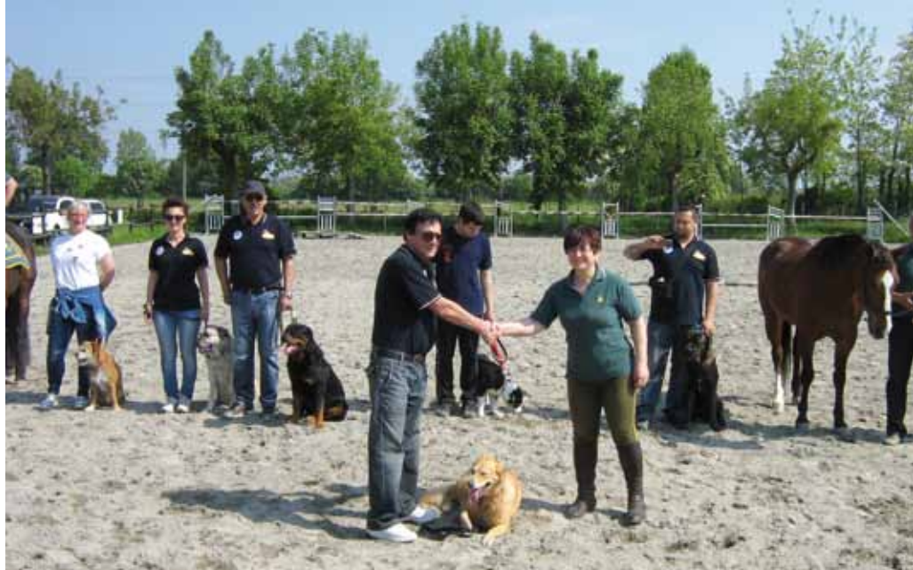
■ Un'immagine dell'esercitazione di ricerca persone organizzata lo scorso anno a Inzago (Milano) dalla sezione locale delle Giacche Verdi Lombardia insieme alla Protezione civile di Cinisello e Cambiogo, in cui si è testato il modulo di ricerca congiunta di unità equestri e cinofile