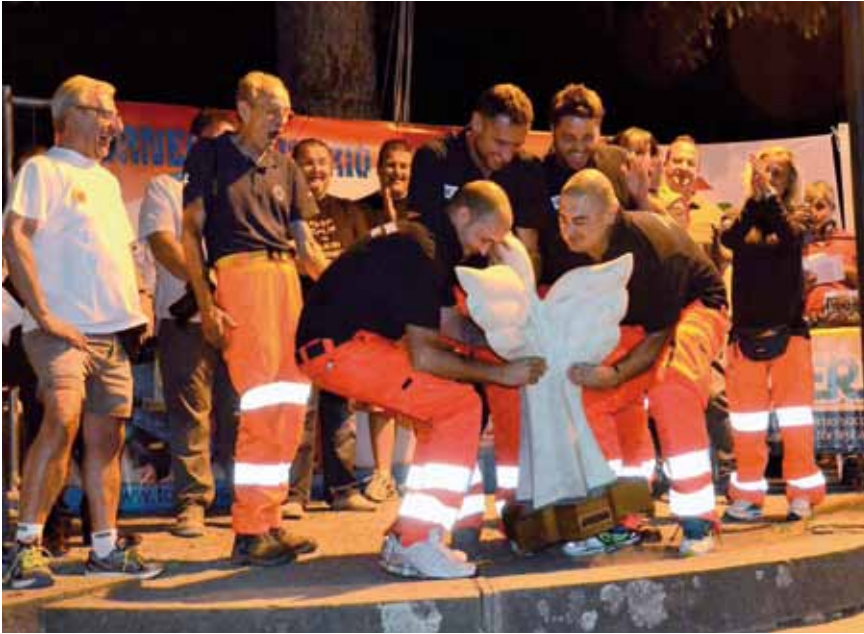
■ L'Associazione EMA di Casalgrande (RE) si è aggiudicata il "Trofeo itinerante"