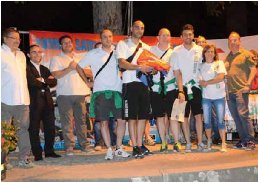
■ Un premio per l'Associazione che arriva da più lontano: quest'anno è andato alla Croce Verde di Asti

costruito dagli uomini del Soccorso Alpino era posizionato tra una diga ed un bosco, per raggiungere il ferito era necessario percorrere un sentiero messo in sicurezza con corde e moschettoni. Il pilota era ancora a bordo dell'elicottero, i soccorritori quindi dovevano estrarlo ed immobilizzarlo su una tavola spinale del Soccorso Alpino che poi provvedeva a calarlo