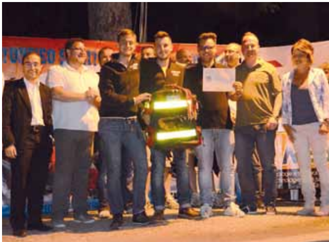
■ Un memento della cerimonia di premiazione. La Croce Blu di Mirandola ritira il premio del secondo classificato. In basso, un'immagine della Croce Verde di Asti, che ha guadagnato il terzo posto